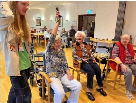
Die sportlichen Spiele mit der Wii machten viel Spaß.